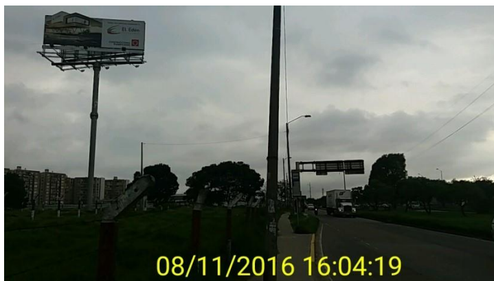
FOTOGRAFIA 2: Vista panoramica del elemento instalado en el predio ubicado en la Avenida Carrera 72 No. 12 B – 60, el cual no cuenta con el registro otorgado por la Secretaria Distrital de Ambiente.